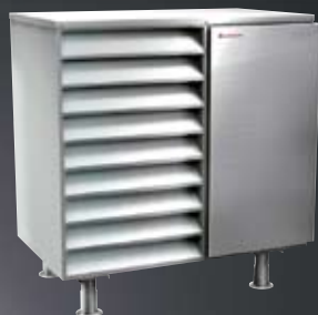
ExoAir / ExoAir Polaris