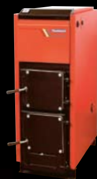
Exonom P20 UB